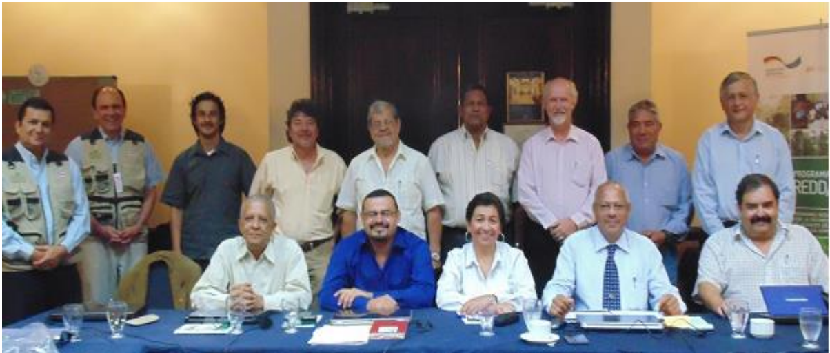
Representantes del GTB, CAC y de Organismos de Cooperación Internacional que apoyan el PERFOR

Sistematización de la Reunión 5 y 6 de noviembre de 2013